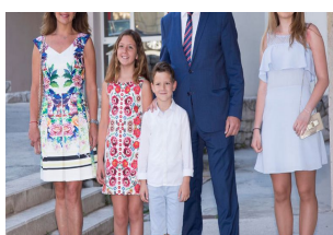
FOTO: TKO JE NOVA PRVA DAMA SPLITA? Samozatajna, odmjerena i bespriješkog stila. Liječnica koja skija, pliva i voli rock...