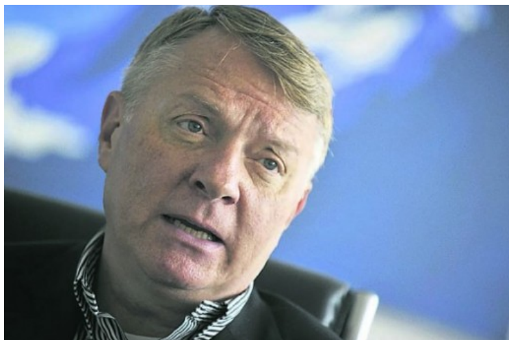
Snimio Mladen Fogec / Nenad REBERŠAK